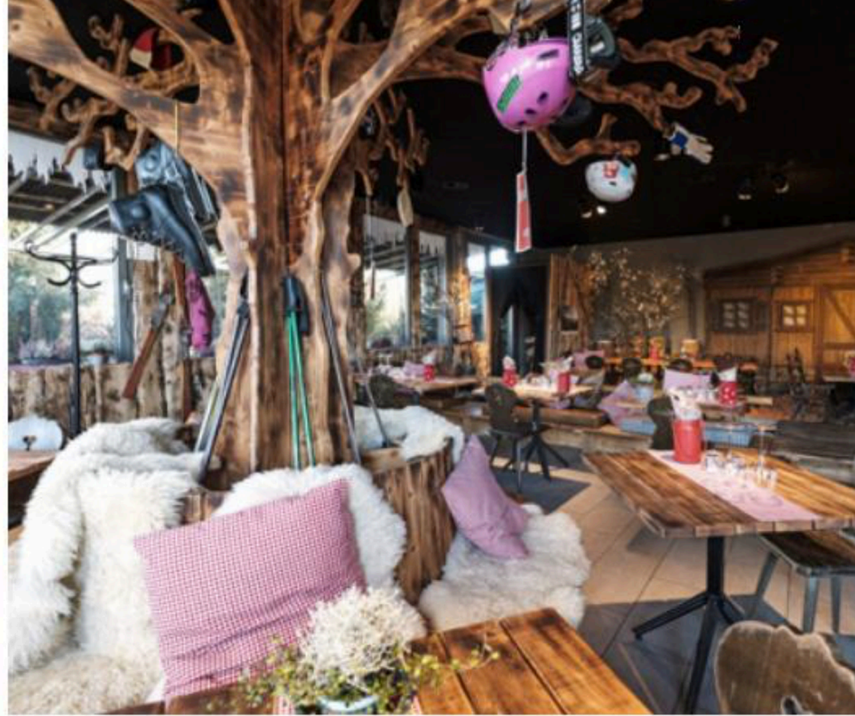
Dinnen wie draussen: im Cabana Corvatsch gibt's bis April 2019 eine grosse Portion an Gaudi, Genuss und Gemütlichkeit